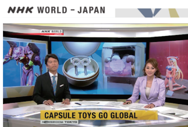
▼TVを通じて知名度が一気に広がりました

NHKによるニュース報道・特番・国際放送(NHKワールド)にてフィギュア製造トップメーカー海洋堂の新たな挑戦として報道されました。一般への認知も高まっています。