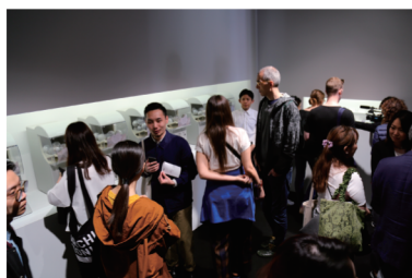
▼人だかりができるイベント会場の様子

イタリアで開催された世界最大級のデザインイベント「ミラノデザインウィーク2018」会場にて「アイデアの素」の先行販売を実施。世界デビューが実現。数千個のガチャカプセルが週内に完売!